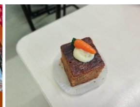
Fruitkrokodil groep 1/2C Worteltjestaart Thijs groep 8