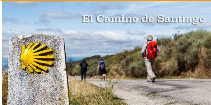
El Camino de Santiago

“In de eigen eenzaamheid ervaart de pelgrim soms een vreemde stilte, die het pad kan openen naar de stilte van binnen, naar de binnenste kern waar de pelgrim zichzelf ontmoet”.